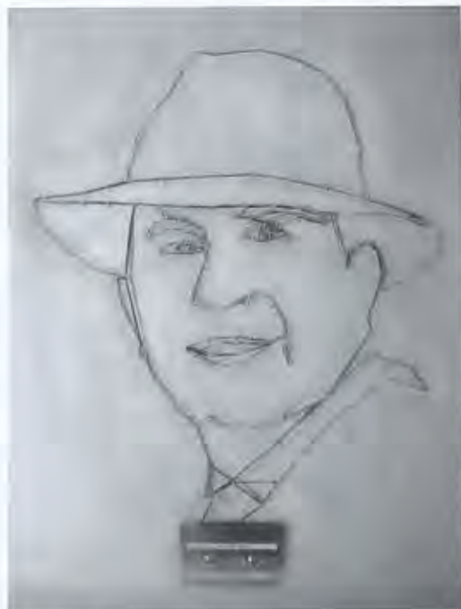
Cassettebandportret van Carlos Gardel

Naast de schoenen staat een klein bronzen beeld van Carlos Gardel. Het is het proefmodel van het eerste echte grote beeld dat Merle maakte, in 2000, het was een opdracht van de Academia de Tango in Amsterdam, waar het beeld nog altijd staat. Toen ze er aan begon, wist ze nog weinig van Gardel, hoogstens dat hij een groot tango-