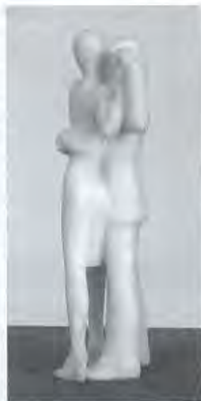
Danspaar in Argentijns marmer (24cm)

De tangodansers worden in haar atelier omringd door stieren. Ik vraag mij af of de stieren iets met het tangopaar te maken hebben. Is een stierengevecht niet ook een soort dans? Hier protesteert Merle heftig tegen: "De stier staat niet in de stal pasjes te oefenen. Bovendien is tango een samenspel tussen twee mensen, terwijl het bij een stierengevecht om een ongelijke strijd gaat. De stierenvechter legt de stier de passen op en het staat van tevoren vast dat de stier verliest. Mijn aandacht gaat uit naar de kracht van het beest. Ik toon de stier in een ineengedoken houding, terwijl hij al halfdood is en tot zijn laatste snik zijn horens omhoog werpt. Die kracht om te overleven tot de laatste snik fascineert mij net zoals de tango mij fascineert. Toch hebben de stieren die ik maak weinig met tango van doen."